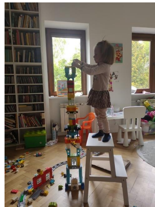
„Pasja w układaniu LEGO. Tu w opcji Duplo, ale to tylko krok przejściowy do przejęcia pudła klocków z dzieciństwa taty :)”