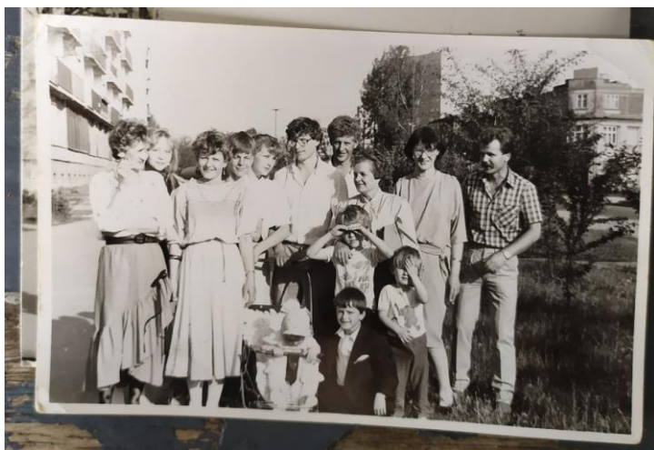
Historia o rodzinnym domu, który łączy pokole